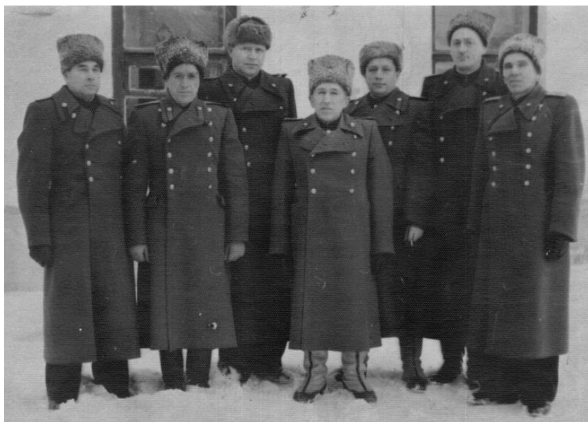
Рис.1. Преподавательский состав кафедры военно-медицинской подготовки 1952 г.

Изучая архивные материалы Рязанского медицинского университета имени академика И.П. Павлова, фотоматериалы кафедры медицины катастроф и скорой медицинской помощи, собирая свидетельства очевидцев, мы попытались восстановить судьбы некоторых руководителей и преподавателей военной кафедры – фронтовиков (Рис. 1).